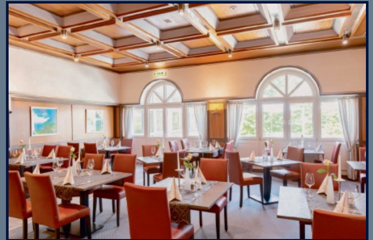
Sonnengarten Hotel & Restaurant Bad Wörishofen · Adolf-Scholz-Allee 5 · ☎ (08247) 30 90

Gültig in der Woche vom 25.05. bis 29.05.2026