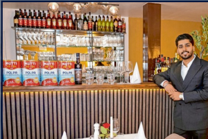
Ristorante Portofino Mindelheim · Maximilianstr. 3 · ☎ (0 82 61) 5027970