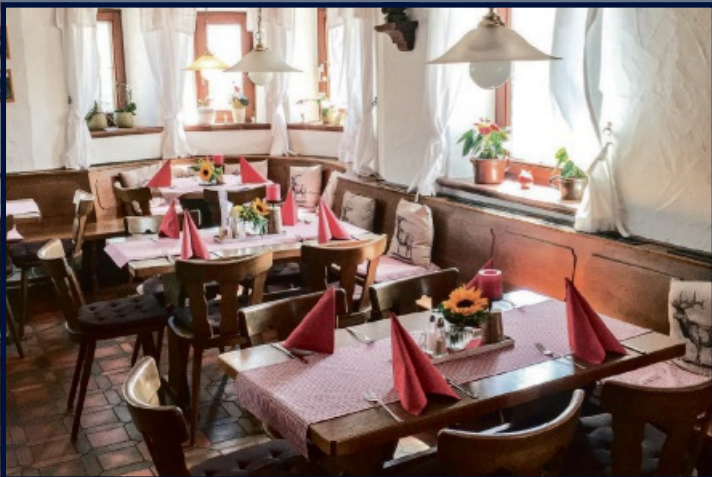
Gasthof zum Hirsch Markt Wald · Hauptstr. 17 · ☎ (082 62) 13 47

Jetzt die Speisenangebote auch online ansehen!