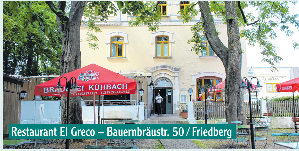
Restaurant El Greco – Bauernbräustr. 50 / Friedberg