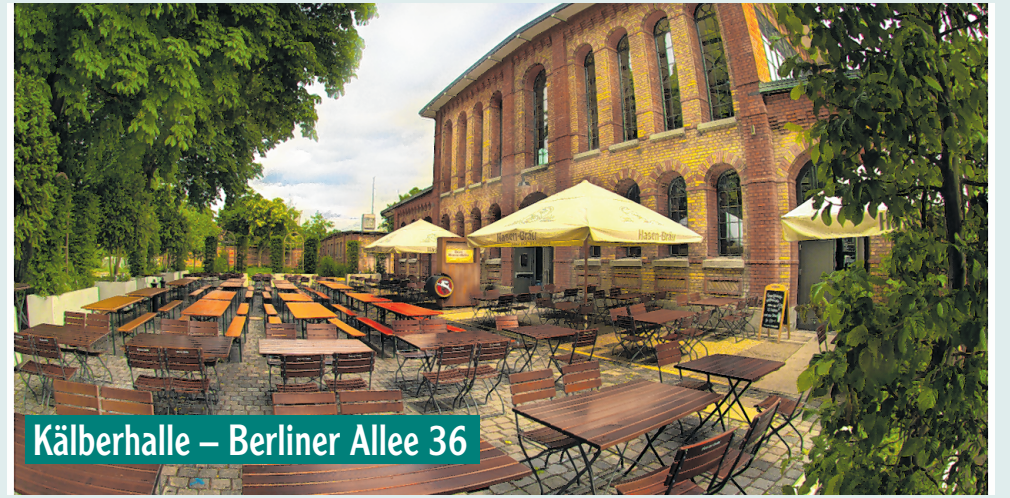
Kälberhalle – Berliner Allee 36

Gültig in der Woche vom 15.7.2024 bis 19.7.2024