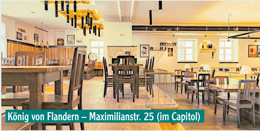
König von Flandern – Maximilianstr. 25 (im Capitol)