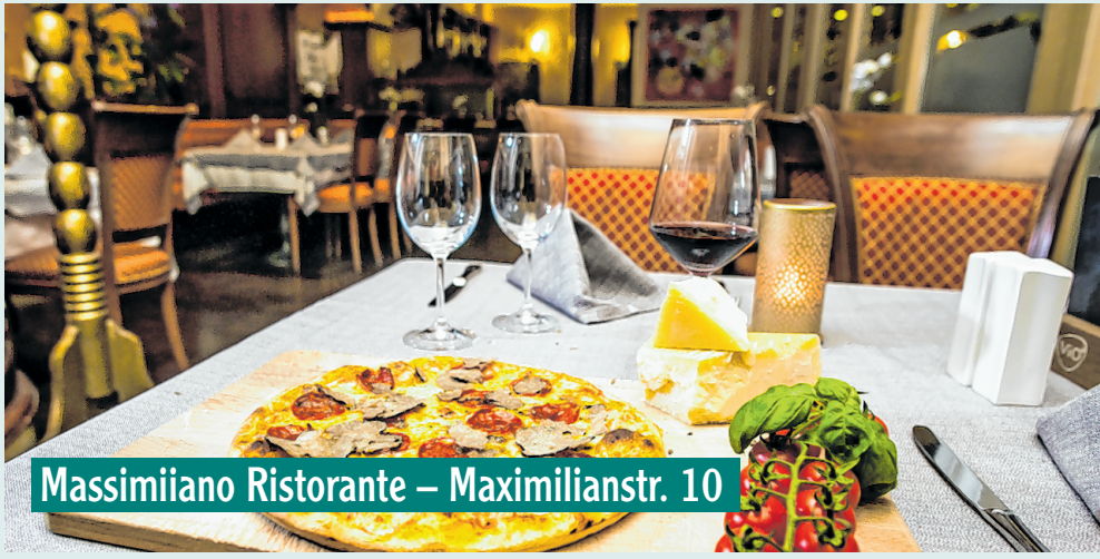
Massimiliano Ristorante – Maximilianstr. 10

ab Montag, 10 Uhr online unter augsburger-allgemeine.de/themenwelten